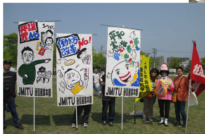
(JMITU通信産業本部・松山市職労の仲間と争議団)