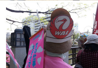
(林さん手作りのWALキャップ)