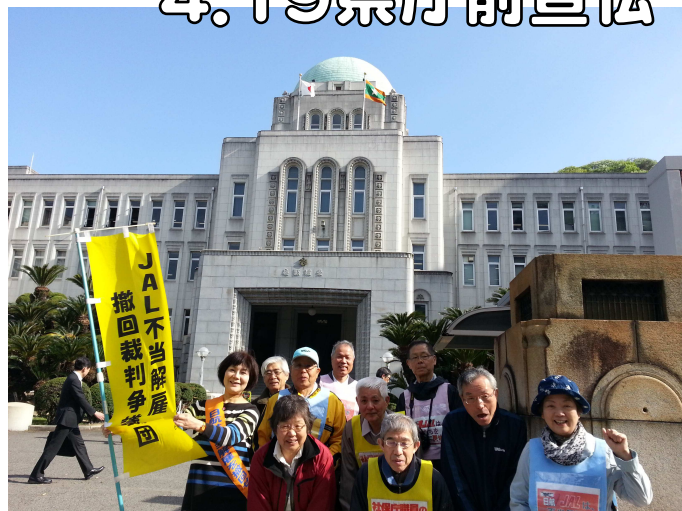
(愛媛県庁をバックに、JAL・社保庁争議団と支援者 4/19)